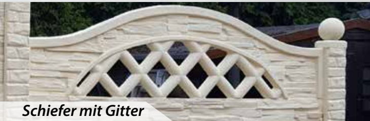
Schiefer mit Gitter