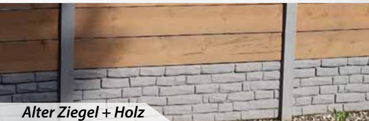
Alter Ziegel + Holz