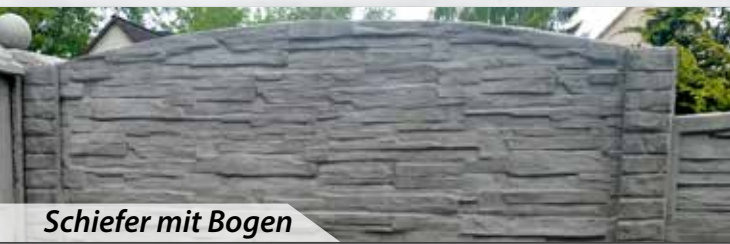
Schiefer mit Bogen